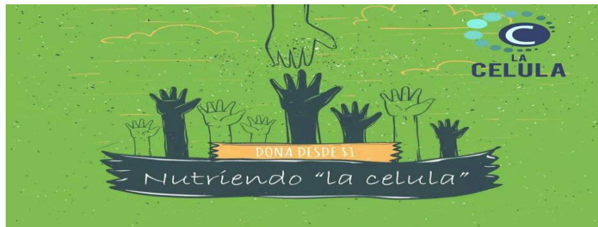
Imagen que se colocará en los sobres de los donantes

Es importante recalcar que la alianza con CCRTV permitirá que nuestro proyecto se dé a conocer con muchas personas que no pertenecen a Elim, lo que nos brinda un plus extra para obtener mayor cantidad de donantes, ya que el canal 27 es el canal más visto de personas protestantes del país.