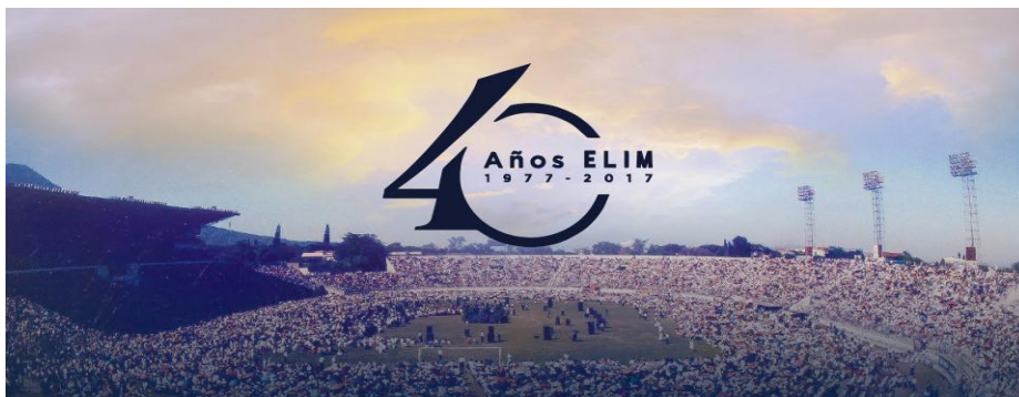
Feligreses de Elim San Salvador en la celebración de sus 40 años